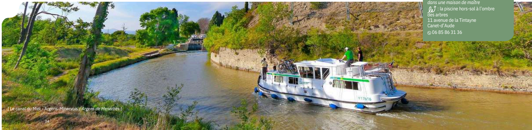
[ Le canal du Midi - Argens-Minervois / Argens de Menerbès ]