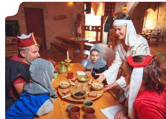
[ Repas en costume d'époque à la Rôtisserie Médiévale ]