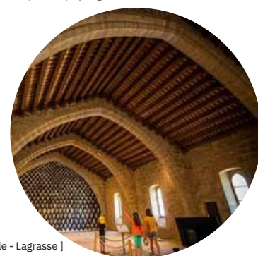
[ Dortoir de l'abbaye médiévale - Lagrasse ]

📍 L'abbaye de Lagrasse a la particularité d'être scindée en deux depuis la révolution française. La partie médiévale, la plus ancienne, offre une palette architecturale et mélange histoire et légende. La visite commentée met à l'œuvre l'imagination grâce à des croquis et des images. On se projette dans ses murs qui n'ont pas toujours été comme on les voit aujourd'hui. Et pour aller plus loin (toujours en famille), on peut réaliser un des trois ateliers proposés durant les vacances scolaires : la création de blasons, le bestiaire fantastique ou l'observation et croquis de paysages.