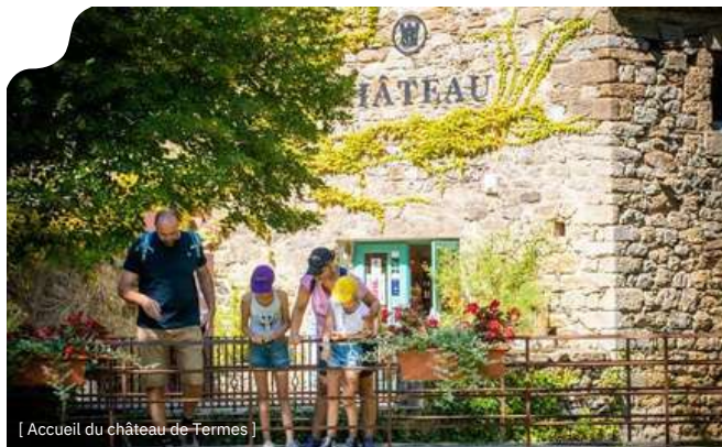
[ Accueil du château de Termes ]

C'est par des petites routes sinueuses et étroites entourées de montagnes que l'on arrive à Termes . Le passage dans les tunnels creusés à même la roche impressionnera à coup sûr les petits. Les vestiges du château surplombent la route, là-haut sur un éperon rocheux. Il faut simplement lever les yeux (et coller un peu le nez à la vitre) pour les admirer. L'arrivée au village surprend, les maisons s'imbriquent les unes dans les autres à même la roche, la nature est partout.